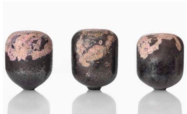
Voir, 2019. Blæst glas med glasfibre og patinering. 38 x 30 cm (diam.)

Det abstrakte, æstetisk bærende lag er væsentlig i min praksis, idet det fører fokus på materialiteten, intensiteten og kompleksiteten i værkerne. Som sanseligt stimulerende skulpturer inviterer de til at opleve dem fra flere vinkler og dermed få forskelligartede oplevelser afhængig deraf.