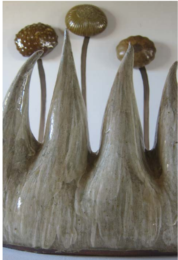
Græs, 2019. Stentøj, 40 x 20 x 35 cm (detalje)

Objekter som påminner om något. Oftast i en storlek, som är bekväm att hantera. Många upprepningar och långsam arbetstakt.