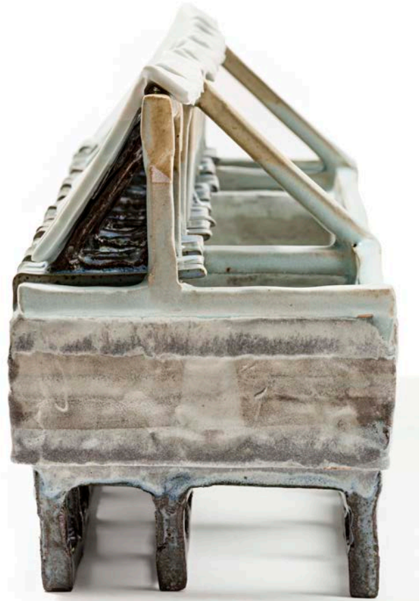
Arkitektonisk værk, 2019. Stentøj og porcelæn, 22,5 x 61 x 17 cm.

Tankerne bag mine værker udspringer af interessen for mønstre og gentagelser, rumlige dimensioner og sammenhænge. Inspirationen opstår både fra byens arkitektoniske dimensioner samt fra naturens iboende symmetri. Fortolkningen bliver en undersøgelse i at lade disse visuelle indtryk og fornemmelser komme til udtryk i leret. Jeg modulerer med elementer af ler, som sættes sammen til adskillige kompositioner. Modul på modul fører til en ny form, hvor de mange små helheder samles til én helhed. Jeg kombinerer porcelæns- og stentøjsler for at vise materialernes kontrast mellem groft/fint og mørkt/lyst. Enkeltheden opstår af værkernes egne lys- og skyggevirkninger, understøttet af de bevidst valgte glasurer, der tilfører taktile kvaliteter såsom mat/blank og forskellige farvesammensætninger.