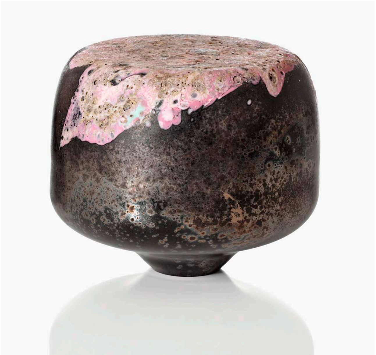
Voir, 2019. Blæst glas med glasfibre og patinering. 38 x 30 cm (diam.)