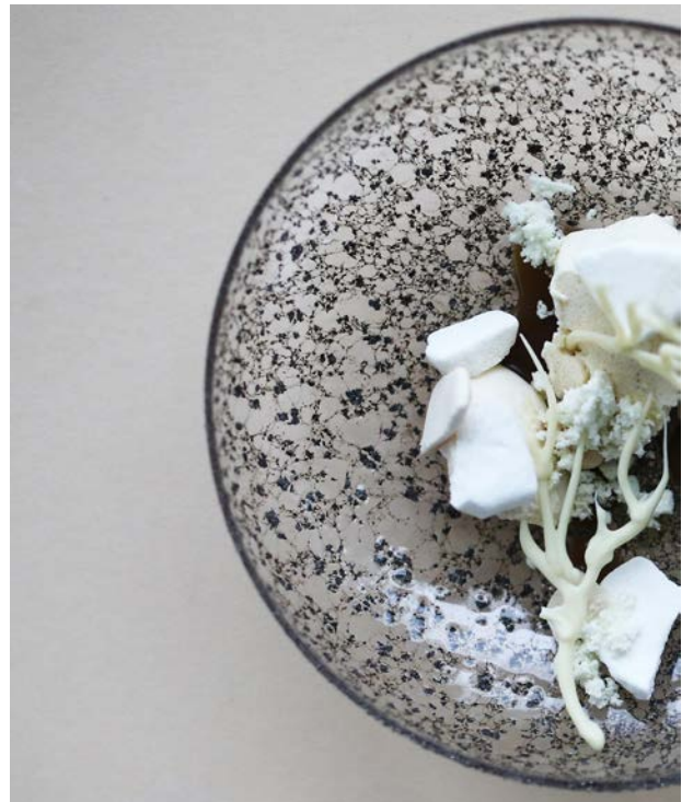
Maj-Britt Zelmer Olsen Mundblæst glas, jernfil spåner. Mad af Daniel Kruse.

nært design- og produktionspræget arbejde, der kommer til udtryk i serieproducerede hverdagsobjekter, restaurantsamarbejder samt designopgaver for virksomheder. Ens for alt hendes arbejde er en udpræget fænomenologisk interesse for keramiske overflader og for at undersøge og udfordre mødet og relationen mellem mennesket og det keramiske objekt, hvad enten det er i funktionel eller sanselig sammenhæng.