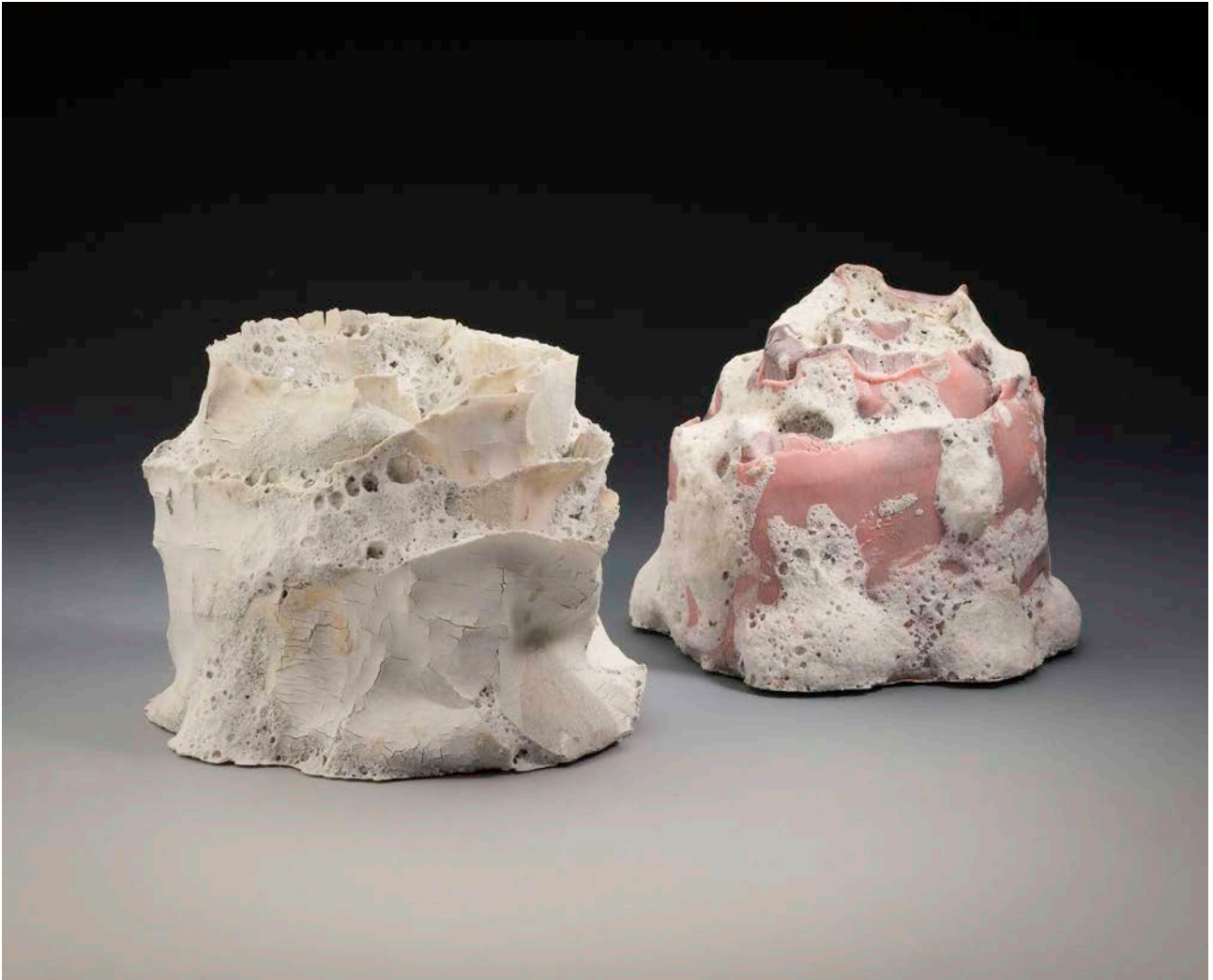
Uden titel, 2016. Indfarvet porcelæn, SiCglasur. Højde 12 cm.