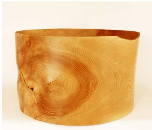
Uden titel, ca. 2017. Asketræ, 41 x 65 cm