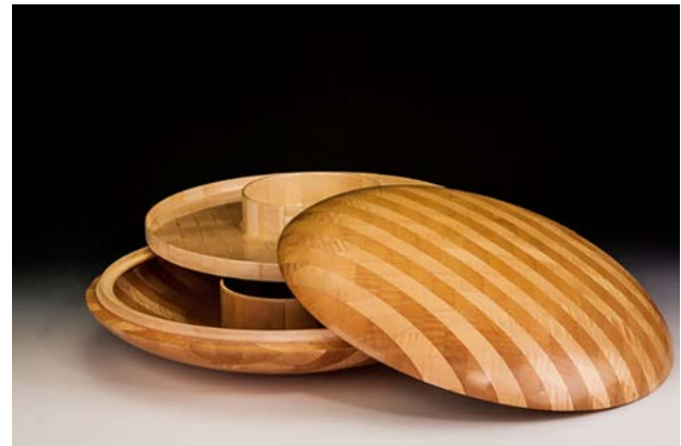
Skrin, 2010. Ahorn, 16 x 52 cm (diam.)