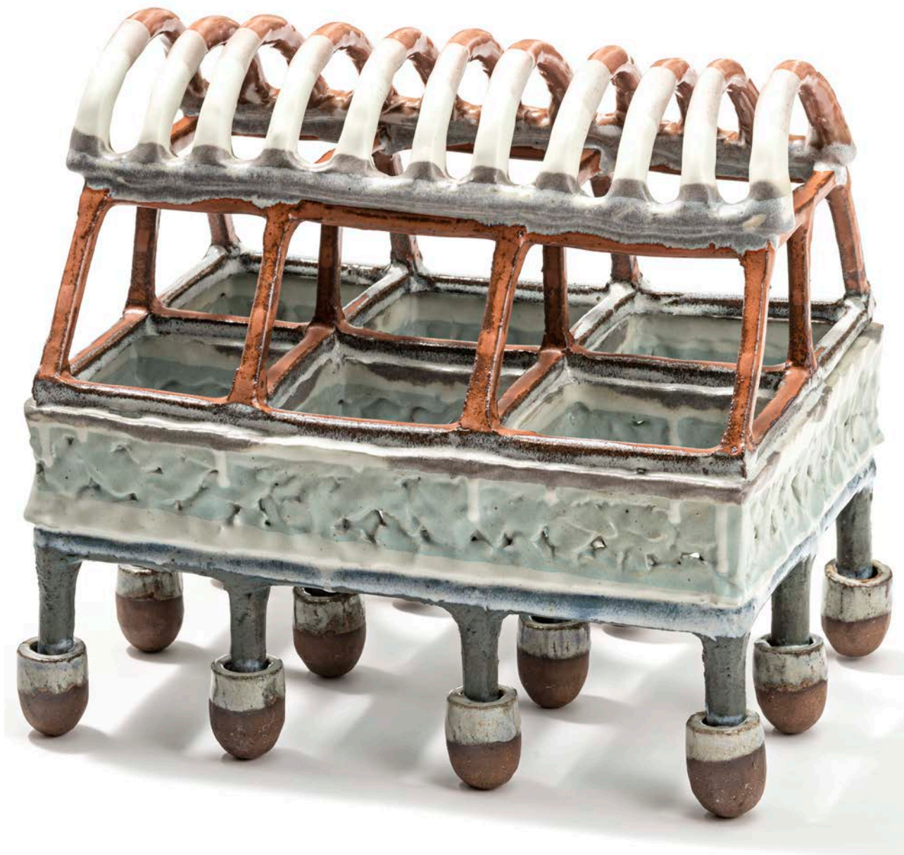
Arkitektonisk værk, 2019. Stentøj og porcelæn, 33 x 36 x 25 cm, 2019.