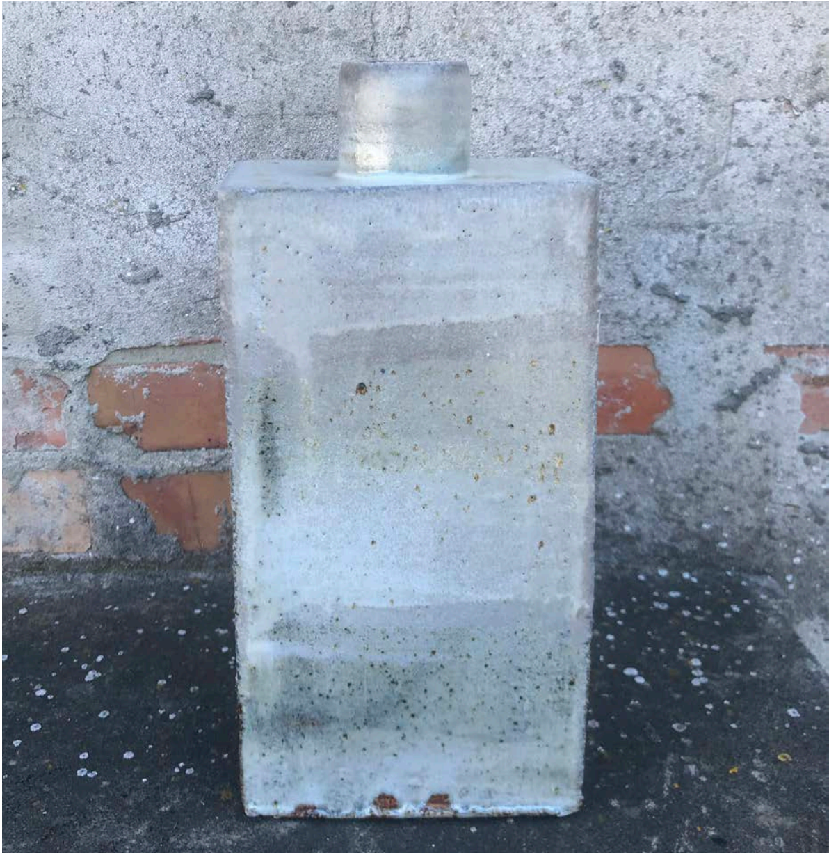
Vase, 2019. Stentøj, 29 x 12 cm