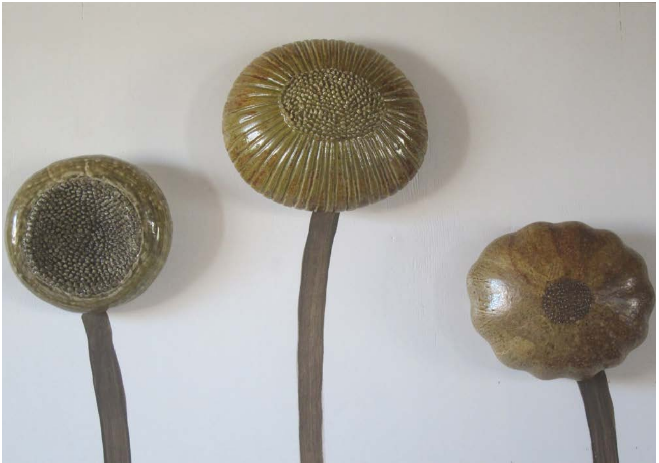
Uden titel, 2019. Stentøj, variable mål (detalje)