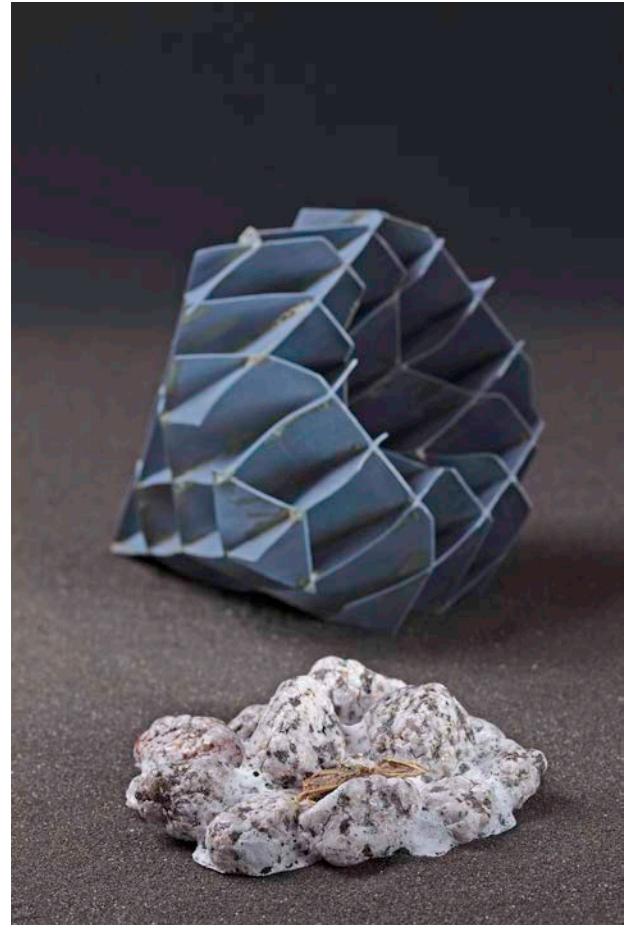
Et andet sted, 2019

Tak til Danmarks Nationalbanks Jubilæumsfond og Statens Kunstfond.