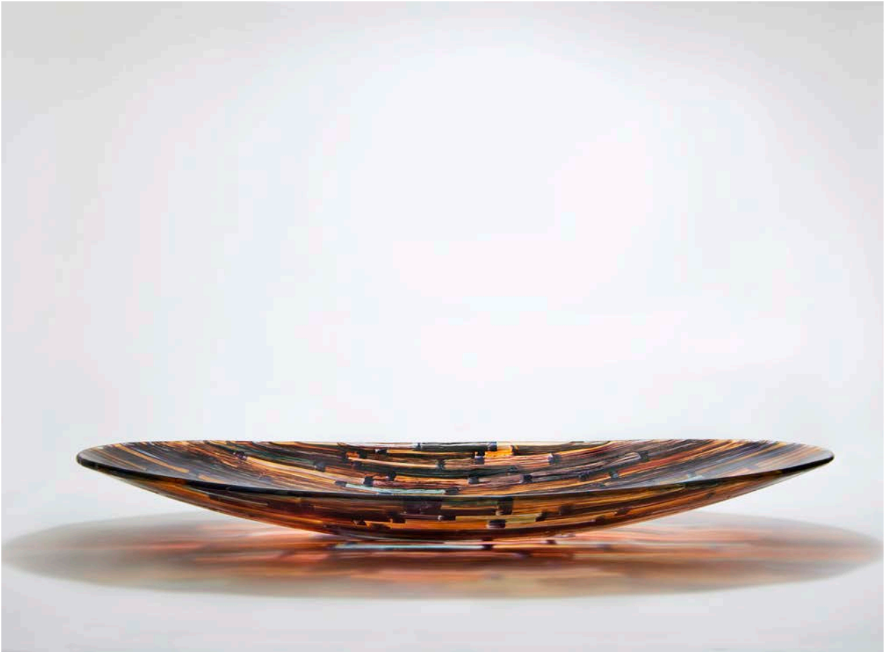
Padderokke, 2013. Glas, 115 x 51 x 17 cm.