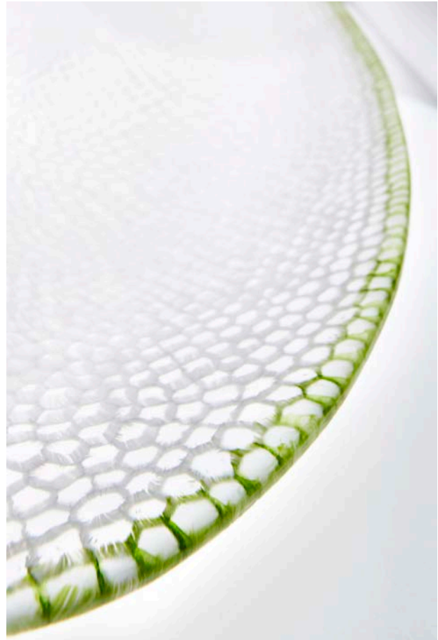
Bikube, 2013. Glas, 115 x 51 x 17 cm

Til denne udstilling viser vi 3 ovale bådformede værker. Inspirationskilderne er: Havet. Padderokker. Bikuber.