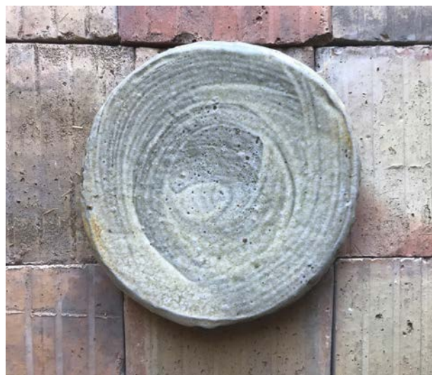
Fad, 2019. Stentøj, diam. 29 cm

Erfaring har lært mig: Aldrig at mene noget om en brænding samme dag, som jeg åbner ovnen. Ethvert nyt forhold bygger på et åbent sind.