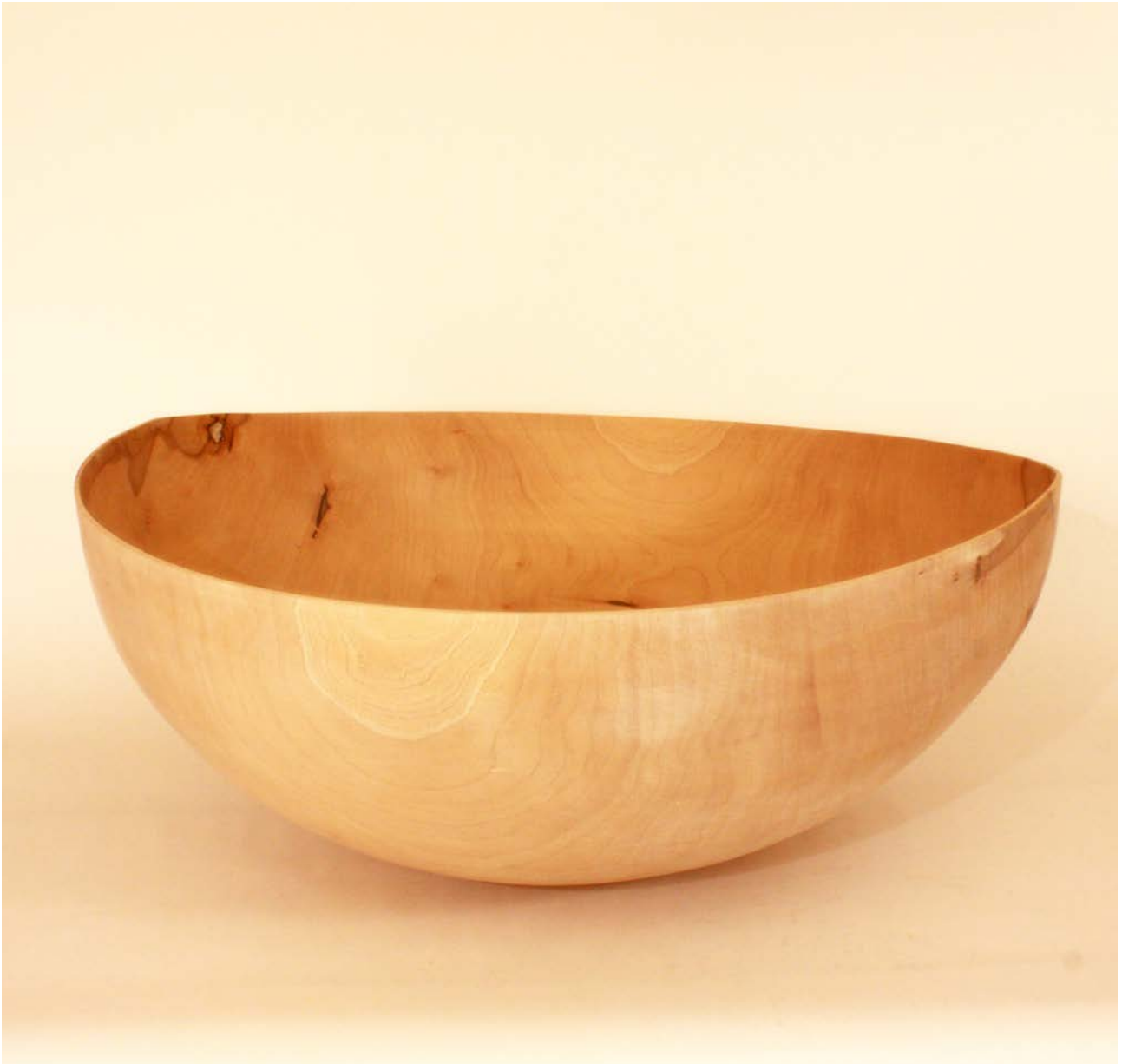
Uden titel, ca. 2015. Ahorntræ, 26 x 60 cm