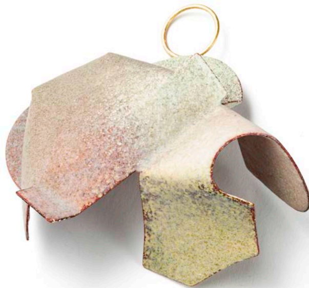
AS SUCH # 1. Broche 2018 Emalje, kobber, sølv, 18 kt guld, 6 x 6 x 2,7 cm Statens Kunstfonds Samling