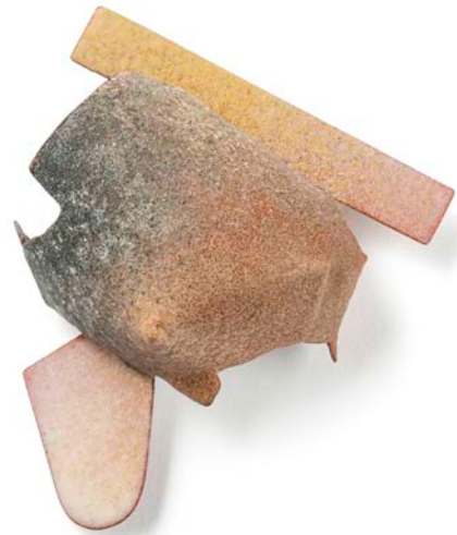
AS SUCH # 3. Broche 2018 Emalje, kobber, sølv, 6,3 x 5,3 x 2,5 cm

Da hver form interagerer med rummet omkring sig, skal snittet løfte hvert enkelt segment samt fremhæve alle disse farveelementer. I et sådant rum begynder alle dele at skabe nye rytmer.